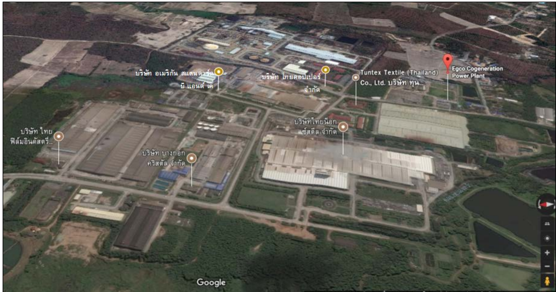
ภาพที่ 2 แผนที่แสดงที่ตั้งโครงการโรงไฟฟ้าเอ็กโก โคเจน ภายในสวนอุตสาหกรรมระยอง